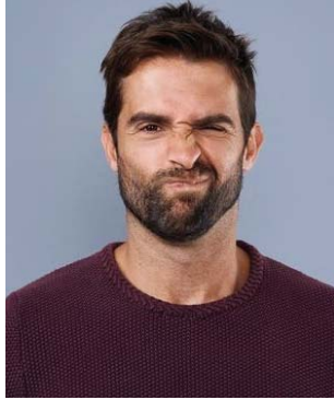
Paralysie de Bell